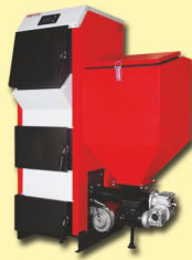
Захисти свій котел. Застосовуй 4-ходовий клапан.

Сталевий котел з авто подачею палива, для спалювання вугілля у вигляді т.в. еко-горошку (фракція до 35мм). Зовнішній корпус пофарбований порошковим напильним на основі оцинкованої листової сталі з термічною причіпкою. Існує можливість на чавунних колосникових решітках спалювати деревину, відходи деревини або кам'яне вугілля. Котел стандартно оснащений форсуною з чавуною топкою з обертальним ободком, що дає можливість скидати попіл. Дає можливість безпечно і дуже ефективно спалювати еко-горошок (фракція до 35мм) та іншого замінне паливо. Автоматика котла еСОМАХ 800 R обслуговує роботу насоса ц.о., а також т.в.п. і циркуляцію. Вбудоване забезпечення STB, автоматика регулює процес спалювання шляхом керування вентилятором вторинного повітря та системою подачі палива, має термічний захист від потрапляння жару до контейнера, має стандартне управління погодний контроль на базі з Individual Fuzzy Logic і вхід для кімнатного контролера. Котел стандартно оснащений чавуною колосниковою решіткою, автоматикою, вентилятором, ящиком для попелу, щіткою і шлакознімачем.