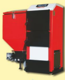
Захисти свій котел. Застосовуй 4-ходовий клапан.

Сталевий котел з авто подачею палива, для спалювання вугілля в вигляді т.зв. еко-горошку (фракція до 35мм), існує можливість на аварійних колючикових решітках спалювати деревину, відходи деревини чи кам'яне вугілля; котел стандартно оснащений стандартною ретортною форсунокю; регулювання температури за допомогою автоматичного котла, контролер регулює роботу двох насосів (Ц.О. та Т.В.П.), має вхід для кінатного термостату, можлива робота ЛПГО для обслуговування лише насоса т.зв. побудова з трьома витісками баується на колонці опалення; захисний листовий метал повністю оцинкований та пофарбований поришковим напленням. Оснащення: комплект для очищення котла (піпка, шлакознімач), автоматика котла, вентилятор вторинного повітря, (виглядний ящик для пополу - під замовлення). Чавунна аварійна колючикова решітка зустрічається у варіанті. Корпус котла оснащений подвійним патрубком живлення і повернення - напр. для простої установки бойлера непрямого нагріву для т.зв.